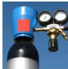
Distributeur de fluides