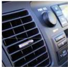
Mécanicien / Technicien des systèmes de climatisation des véhicules